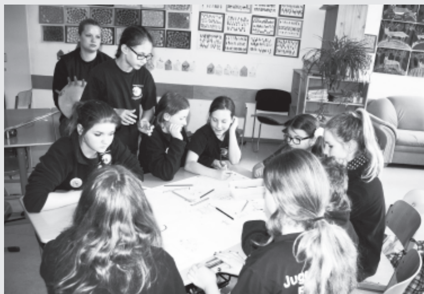
Kreative Aufgaben gehören zum Wettbewerb.

Die Gruppen Benningen (Stufe 2) und Poppenweiler (Stufe 3) konnten sich für den Bereichsentscheid in Schwäbisch Gmünd qualifizieren.