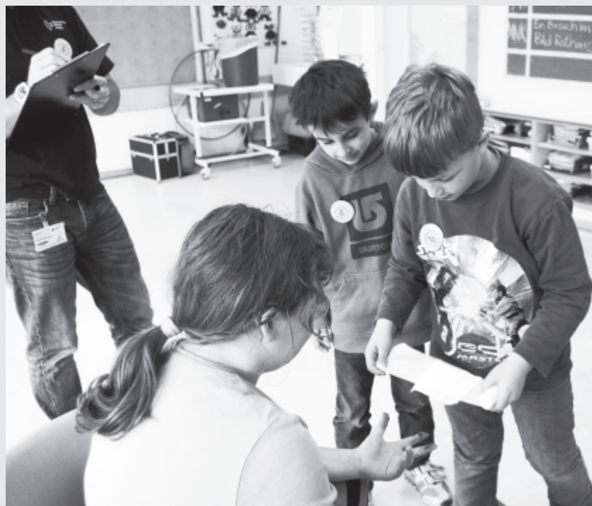
Gelernt ist gelernt und zu zweit lässt sich der Verband gut anlegen.