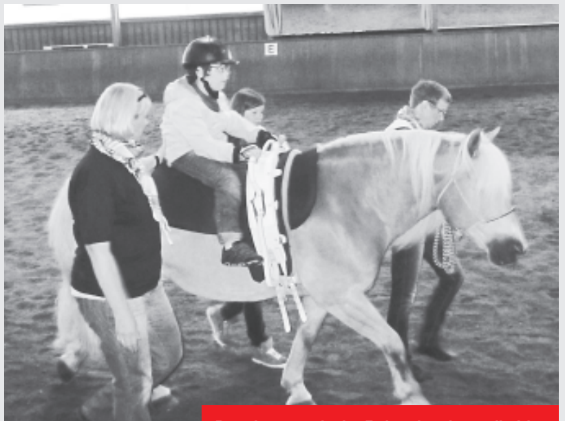
Das therapeutische Reiten ist eine tolle Idee.

Die Behinderten präsentierten ihre Reitkünste auf dem Rücken der Pferde. Nur durch ein gutes und vertrauensvolles Verhältnis