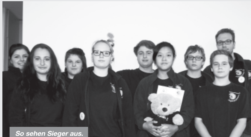
So sehen Sieger aus.

Teamfähigkeit, Geschicklichkeit, Beobachtungsvermögen und Kombinationsfähigkeit waren bei „Sport und Spiel“ gefragt. In ein Foto waren verschiedene Fehler eingebaut, die von den Teilnehmern gefunden werden mussten. Für jeden gefundenen Fehler gab es einen Buchstaben, die am Ende zu einem Lösungswort zusammengesetzt werden mussten. Die Aufgabe „Klötze drehen“ konnte nur im Team bewältigt werden. Jeder Teilnehmer stand auf einem Holzklotz, der um 180 Grad gedreht werden musste. Dabei durften die Teilnehmer nicht den Boden berühren. Alle Bereiche zählen gleichwertig zu der Gesamtwertung.