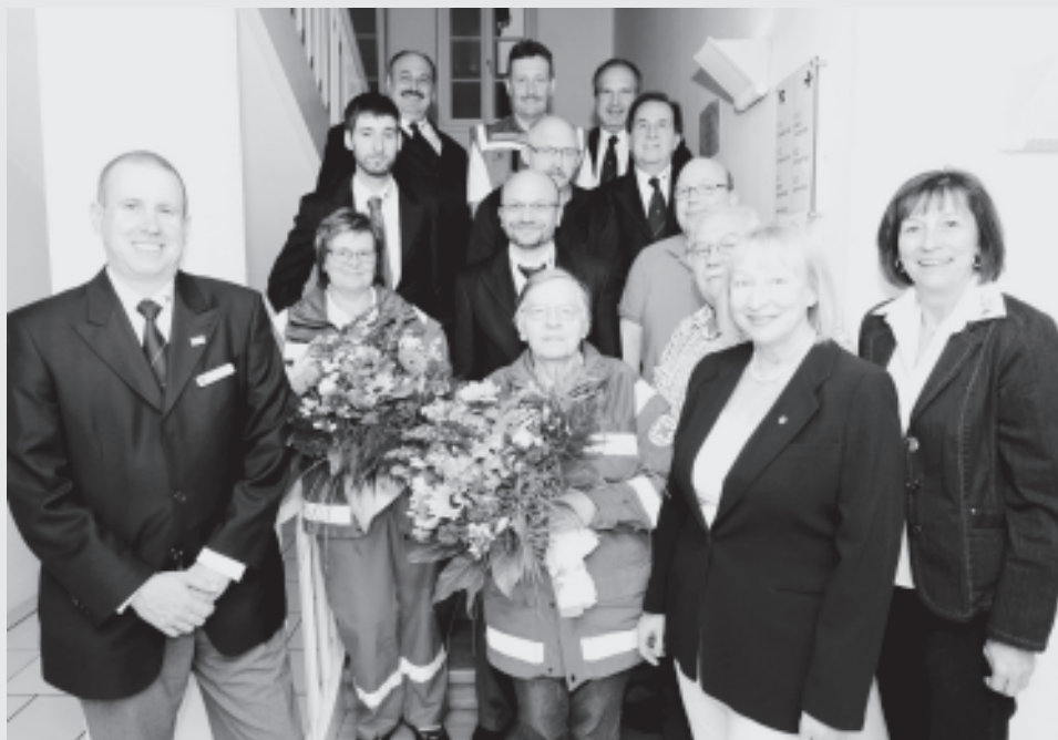
Geehrte und Vorstandsmitglieder des OV Ludwigsburg.

Die Berichte des Kassiers und der Kassenprüfer ergaben das Bild eines finanziell stabilen Ortsvereins. So konnten Vorstand und Kassier problemlos entlastet werden. Zu guter Letzt konnten