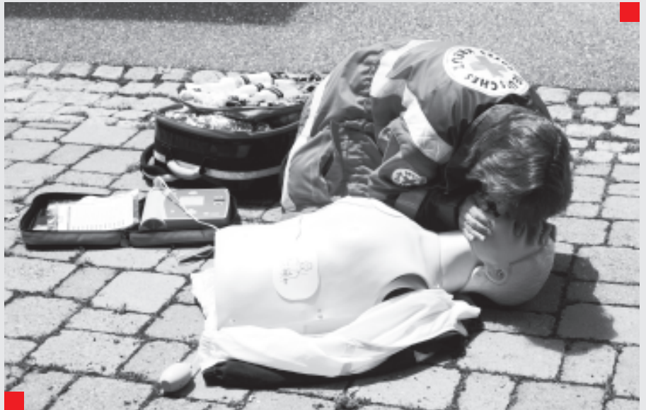
Realistische Übungsaufgabe für die neuen Helfer vor Ort.